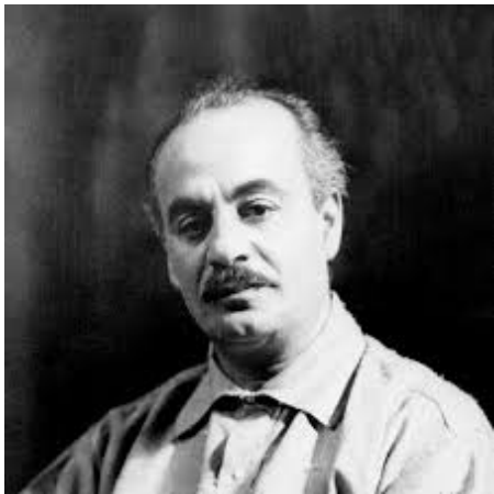
جبران خلیل جبران